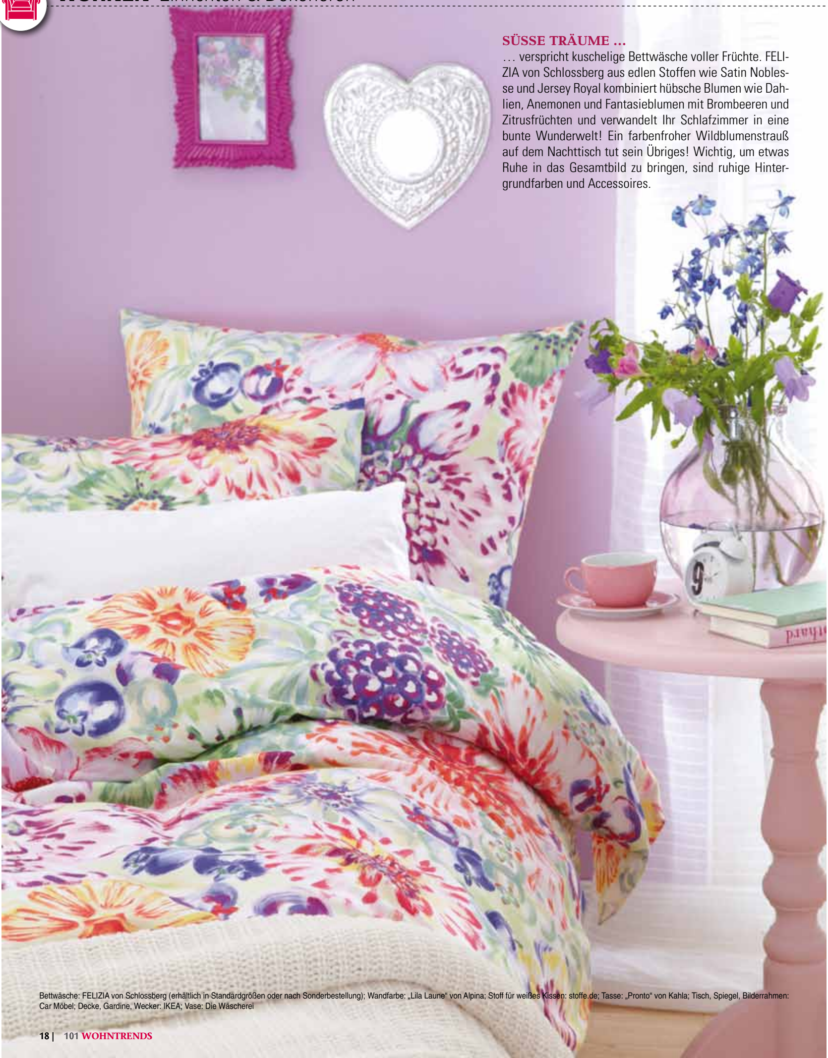
Bettwäsche: FELIZIA von Schlossberg (erhältlich in Standardgrößen oder nach Sonderbestellung); Wandfarbe: „Lila Laune“ von Alpina; Stoff für weißes Kissen: stoffe.de; Tasse: „Pronto“ von Kahla; Tisch, Spiegel, Bilderrahmen: Car Möbel; Decke, Gardine, Wecker: IKEA; Vase: Die Wäscherei

... verspricht kuschelige Bettwäsche voller Früchte. FELIZIA von Schlossberg aus edlen Stoffen wie Satin Noblesse und Jersey Royal kombiniert hübsche Blumen wie Dahlien, Anemonen und Fantasieblumen mit Brombeeren und Zitrusfrüchten und verwandelt Ihr Schlafzimmer in eine bunte Wunderwelt! Ein farbenfroher Wildblumenstrauß auf dem Nachttisch tut sein Übriges! Wichtig, um etwas Ruhe in das Gesamtbild zu bringen, sind ruhige Hintergrundfarben und Accessoires.